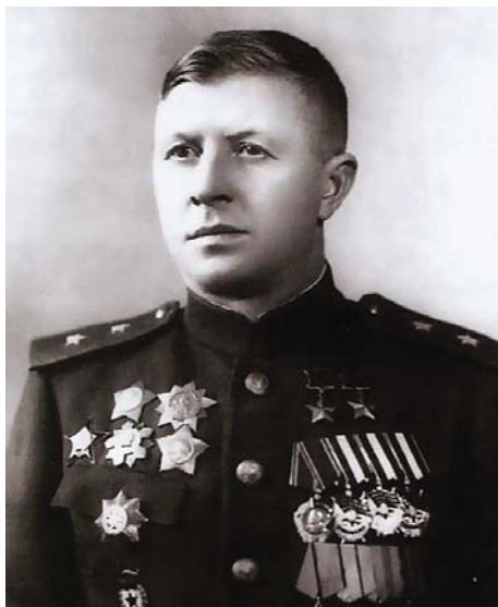
Генерал-лейтенант А.И. Родимцев

ник, не считаясь ни с чем, шаг за шагом прорывался через развалины всё ближе к Волге. Перелом в эти тяжёлые и, временами казалось, последние часы, был создан 13-й гвардейской дивизией Родимцева. Переправившись в Сталинград, она сразу же контратаковала про-