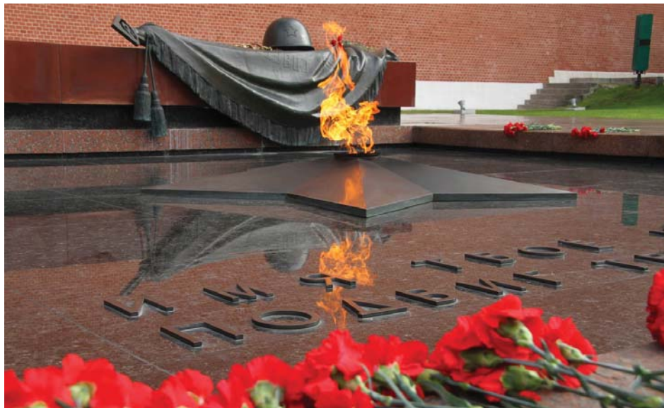
В День защитника Отечества главные праздничные мероприятия проводятся в Москве. У стен Кремля проходит церемония возложения цветов к Могиле Неизвестного Солдата. Мероприятие завершается маршем почетного караула.

Обнародование 22 февраля 1918 года этого документа и появление разъясняющих статей в «Правде», «Известиях ВЦИК» и в других газетах, в том числе местных, всколыхнуло всю Советскую Россию. 23 февраля газеты снова призывали отдать все силы и средства на оборону страны и революции. «Правда» вышла в этот день с аншлагом: «Немецкие генералы организовали ударные батальоны и врасплох, без предупреждения напали на нашу армию, мирно приступившую к демобилизации [с фронтов Первой мировой войны]. — Ред.]. Но уже