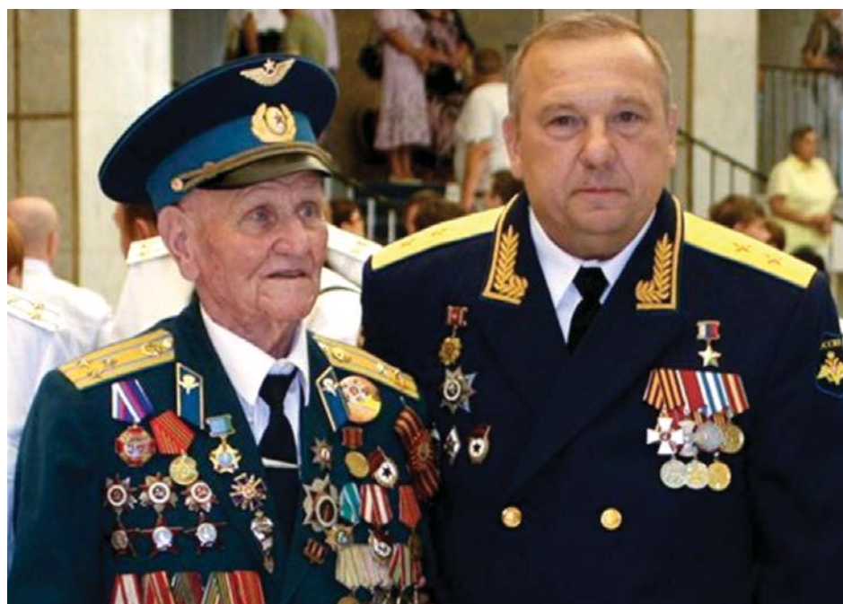
23 февраля принимают поздравления ветераны войн и военнослужащие Вооружённых Сил. В этот день им присваивают внеочередные звания, повышают в должностях, награждают орденами, медалями и грамотами (фото из архива РАГ, 2011 г.)

сопротивление организуется. Оно растёт и будет расти с каждым днём. (...) Рабочие, крестьяне, солдаты! На защиту Советской Республики! Все, немедленно, в ряды Красной Армии!».