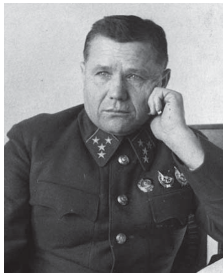
Генерал-полковник А.И. Еременко

Задержка советского контрнаступления позволила немцам начать 11 ноября четвёртый штурм Сталинграда, но